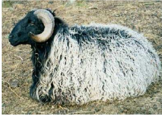
قره گل خاکستری شیراز (کبوده شیراز)