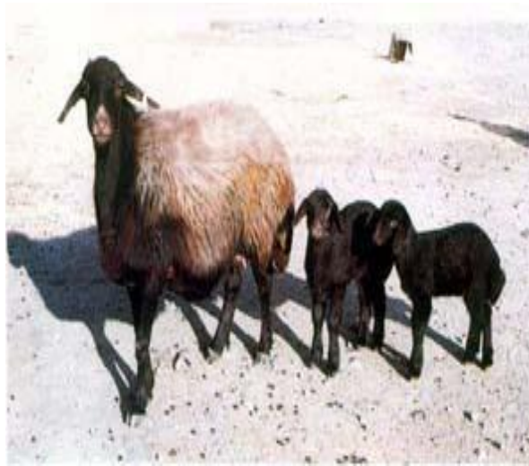
گوسفند قره گل

نژادی است پوستی - گوشتی، رنگ بدن در بدو تولد سیاه و در بلوغ به رنگ خاکستری تغییر می یابد. میانگین وزن: قوچ 72/5 کیلوگرم و میش 52/5 کیلوگرم